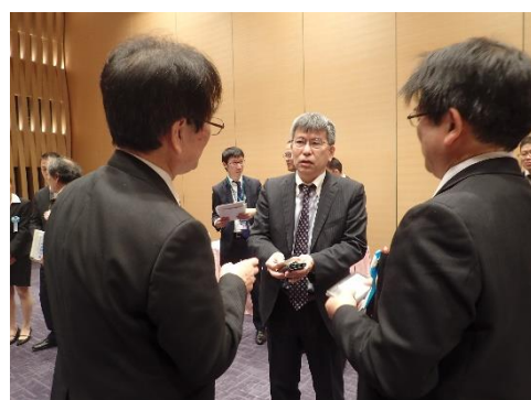
読売新聞東京本社編集委員・服部様と